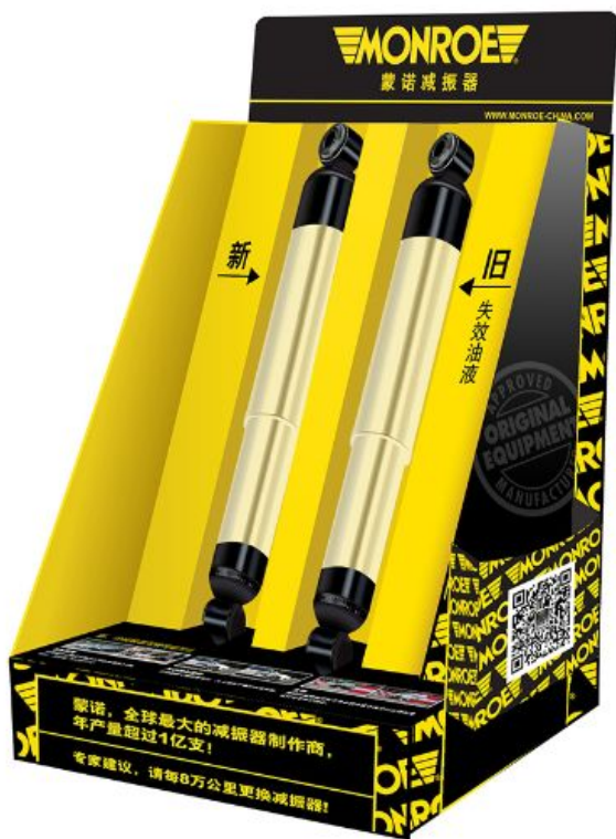
新旧减振器展示道具