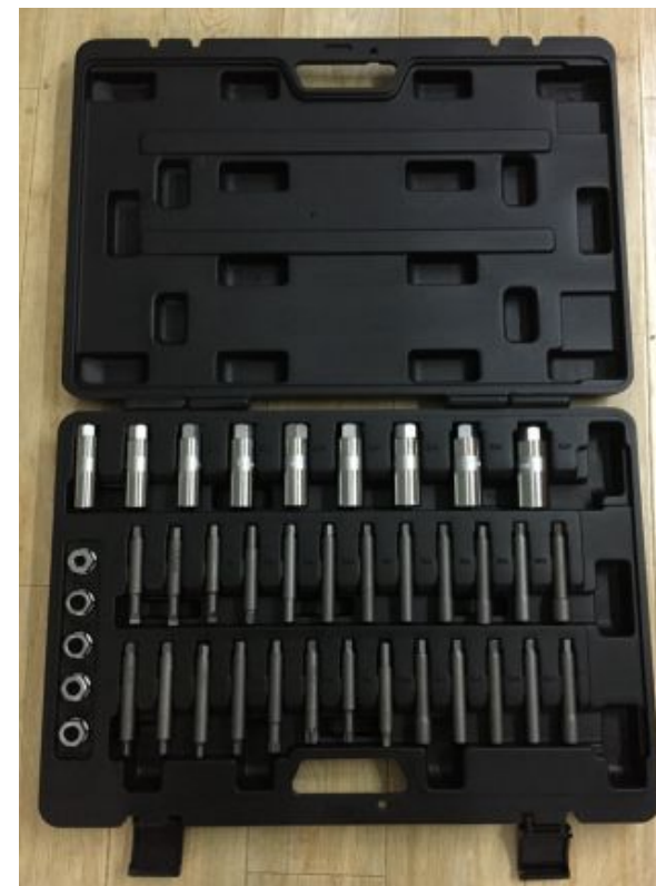
专业顶胶拆装工具