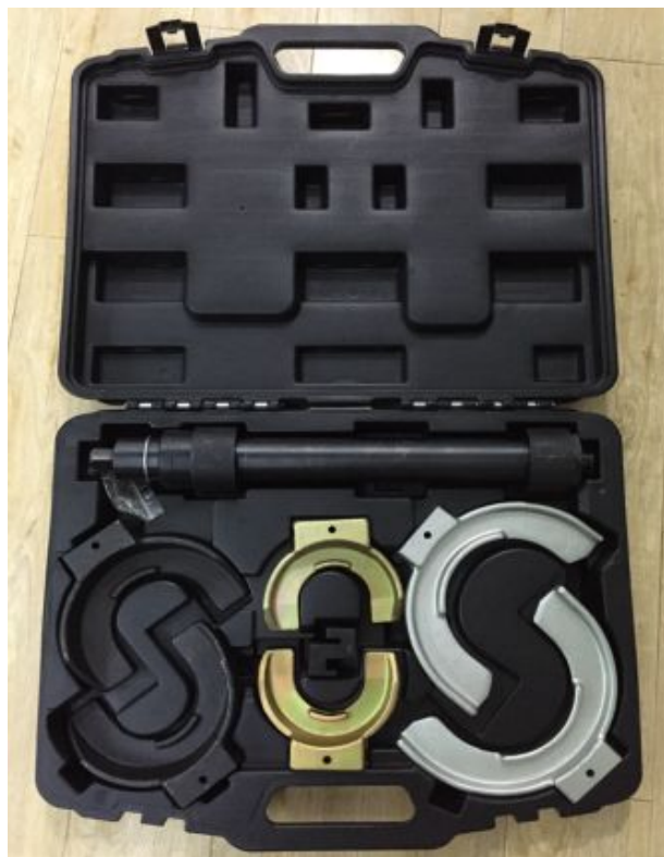
免拆式弹簧拆装工具